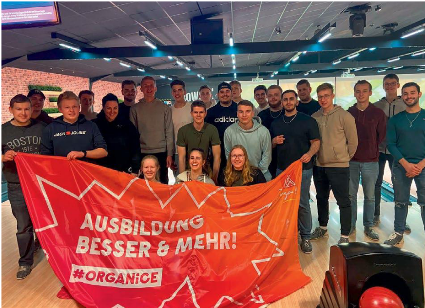
Einige Auszubildende (erstes und zweites Ausbildungsjahr) von Schmitz Cargobull

JUGEND Erfolgreiche Veranstaltung zum Nachmachen: Die Auszubildenden von Schmitz Cargobull trafen sich zum »Gewerkschaftsbowling«.